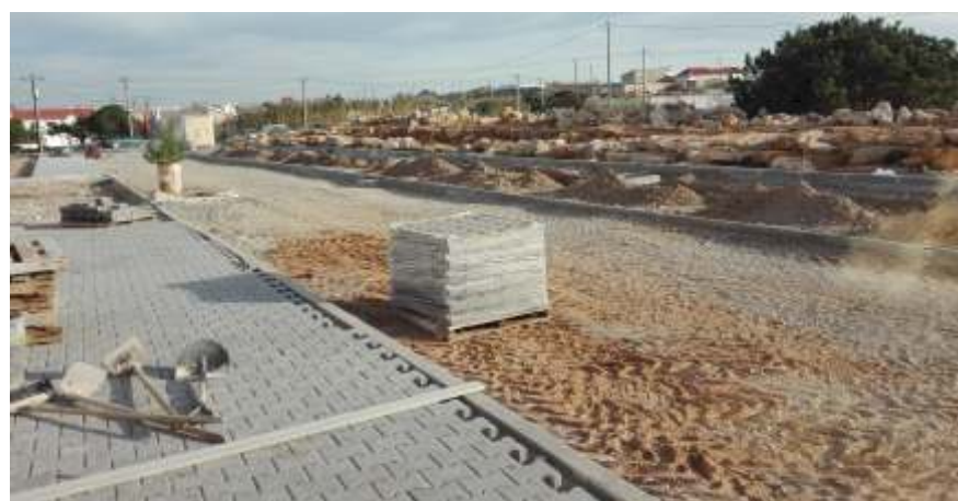
Escola Superior de Turismo e Tecnologia do Mar - IPL Construção de Arruamento

Contam-se entre as concretizações no âmbito das obras municipais: intervenções de asfaltamento – aplicação de massa betuminosa a quente – no Baleal Sol Village I e na Consolação; construção de arruamento junto ao IPL / Escola Superior de Turismo e Tecnologia do Mar; limpeza do leito e consolidação das margens do rio do Casal Moinho; reparações em edifícios municipais, pavimentos, calçadas e passeios; intervenções diversas em espaços verdes e praias; limpeza e reposição de sumidouros; intervenções em habitações sociais e reparações nas escolas básicas e jardins de infância; apoio logístico a festividades; manutenção de edifícios e equipamentos municipais ou de gestão municipal.