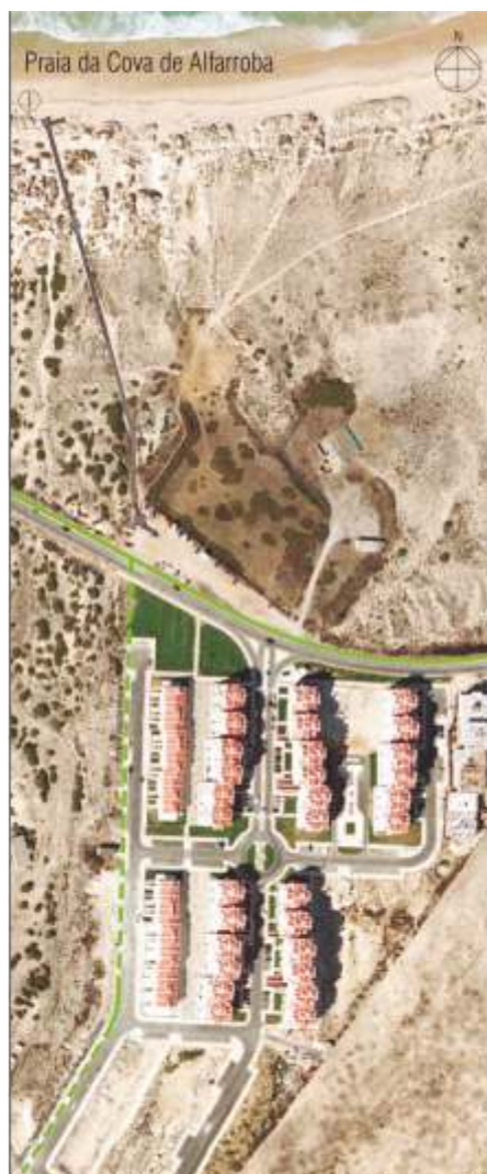
Construção da Rede Pedonal e Ciclável da Entrada de Peniche Programa Valorizar - Ligação A