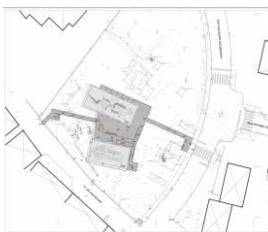
Musealização do Sítio Arqueológico do Morraçal da Ajuda