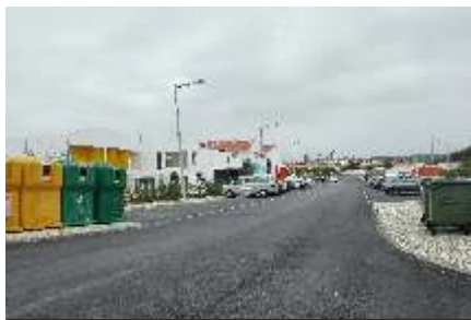
Baleal Sol Village I Asfaltamentos