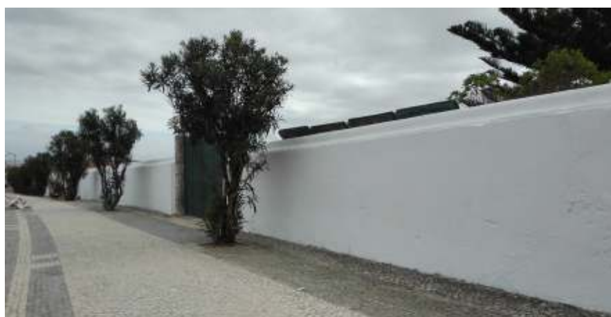
Cemitério de Peniche Pintura de muros exteriores