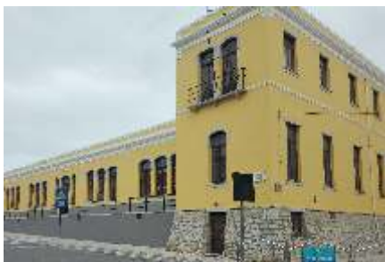
Escola Velha Reparações e pintura