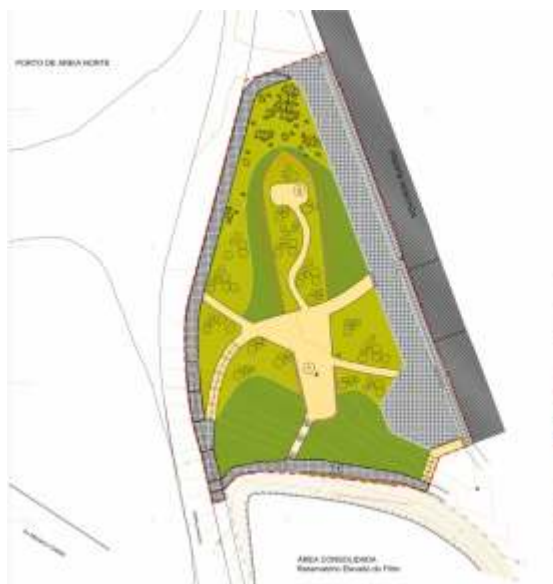
Depósito Funerário de Catástrofe do Naufrágio do Navio San Pedro de Alcantara

O Programa-base do projeto de Requalificação da 2.ª fase do Fosso das Muralhas de Peniche e zona envolvente foi aprovado em reunião de câmara de 01/10/2018 e apresentado em sessão pública no dia 13 do mesmo mês. O documento aprovado consiste no Programa Base revisto, fazendo a incorporação dos comentários críticos elaborados pelos Serviços Técnicos do município, bem como das observações emergentes nas sessões da Câmara e Assembleia Municipal de Peniche.