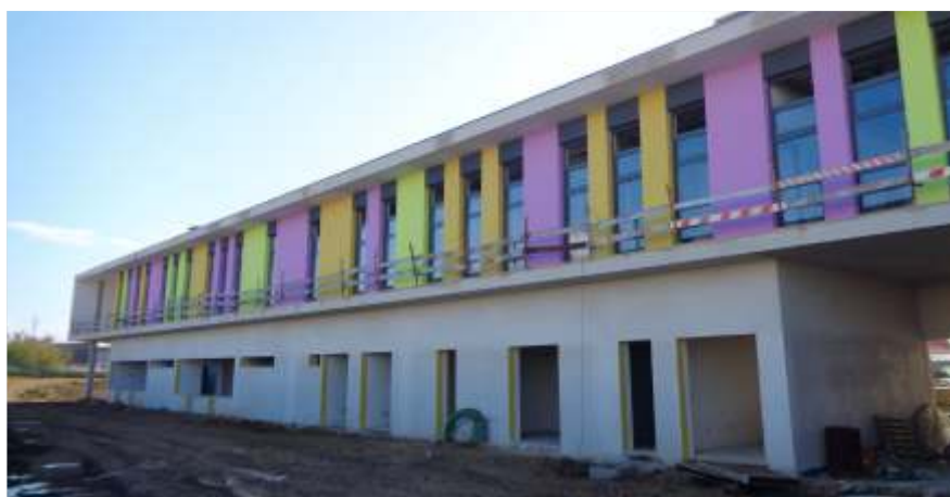
Centro Escolar de Atouguia da Baleia Retificações à construção