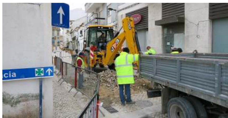
Largo 5 de Outubro Reposição de Sumidouros