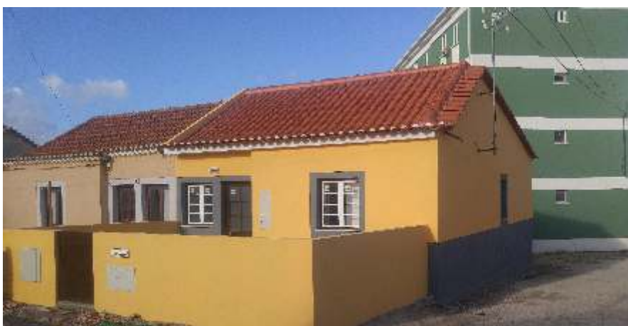
Bairro do Calvário Intervenções em habitações sociais