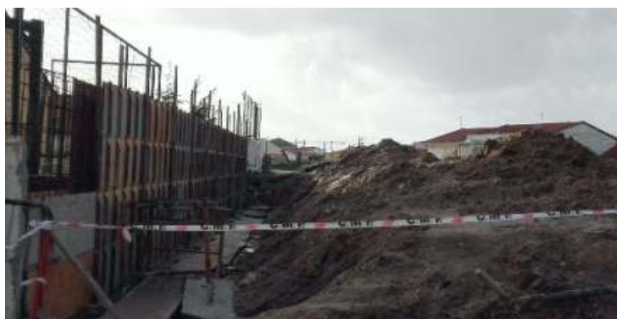
EB de Ferrel Reconstrução do Muro