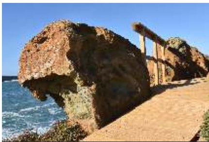
Papôa Construção de acesso pedonal