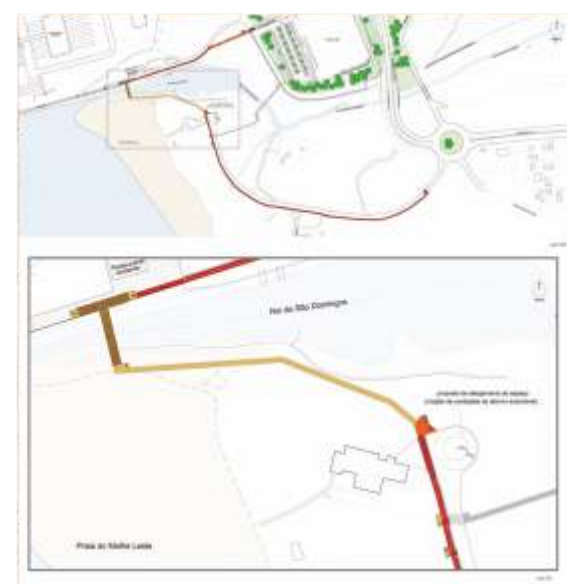
Construção da Rede Pedonal e Ciclável da Entrada de Peniche Programa Valorizar - Ligação B