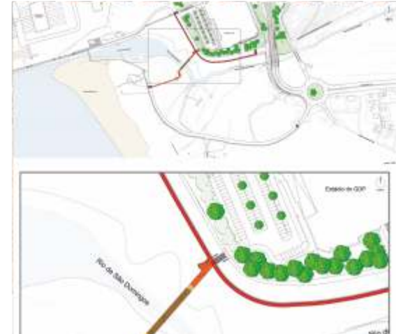
Construção da Rede Pedonal e Ciclável da Entrada de Peniche Programa Valorizar - Ligação C