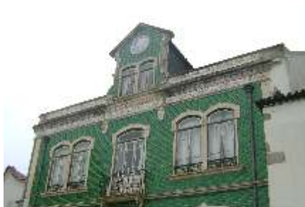
Edifício dos Vallas Reabilitação da cobertura