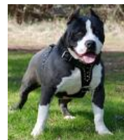
American Pitbull Terrier