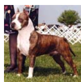
Staff. Terrier Americano