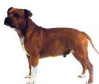
Staff. Bull Terrier