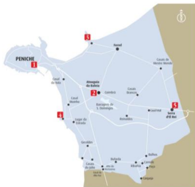
Património Religioso do concelho de Peniche: Pontos de Interesse (mapa à esquerda)

Itinerary of the Religious Heritage PENICHE Municipality