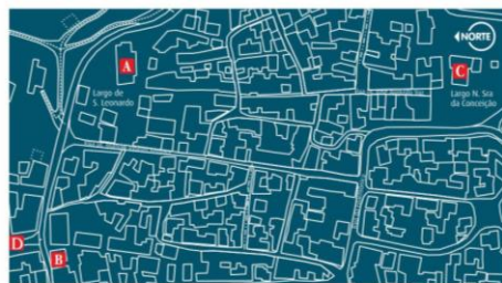
Património Religioso da Vila de Atouguia da Baleia