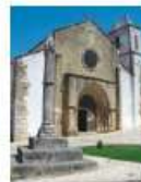
Igreja de S. Leonardo Atouguia da Baleia