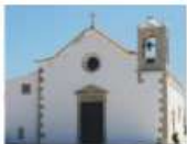
Igreja de N. S.ª da Ajuda Peniche

Local de Interesse Público | Largo de S. S. da Conceição, Vila de Atouguia da Baleia | Freguesia de Atouguia da Baleia Coordenadas GPS lat. 39 21 11 019; long. -9 19 51 009