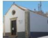
Igreja da Misericórdia de Atouguia da Baleia Atouguia da Baleia