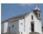
Igreja de S. Sebastião Serra d'El-Rei