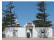
Capela de N. S.ª dos Remédios Peniche