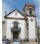
Igreja da Misericórdia de Peniche Peniche