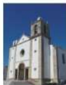
Igreja de S. Pedro Peniche