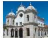
Igreja de N. S.ª da Conceição Atouguia da Baleia